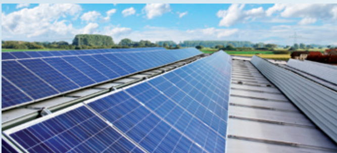
Mit der Photovoltaik-Anlage auf dem Werksdach produziert HSM eigenen Sonnenstrom. HSM produces its own solar electricity with the photovoltaic system on the factory roof.

Wir zerkleinern die Späne aus der Mechanischen Fertigung mit HSM-Shreddern. Dadurch wird das Volumen der Späne verringert und das Gewicht einer Containerfüllung um ca. 35% erhöht. Daraus folgt eine Reduzierung der Entsorgungsfahrten.